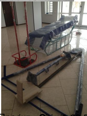
86 Проект «Світло» - 525 бібліотека для дітей у с. Іршаві, вул. Шевченка, 50. Увага! Інформація про цей проєкт була опублікована в газеті «Світло» 12.01.2018 р.