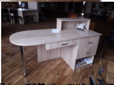
87 Проект «Світло» - 525 бібліотека для дітей у с. Іршаві, вул. Шевченка, 50. Увага! Інформація про цей проєкт була опублікована в газеті «Світло» 12.01.2018 р.