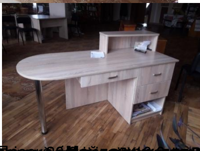
87 Проект «Білий світ» - 616 садівництво у с. Іршачі, Іршачанська громада, Іршачанський район, Львівська область