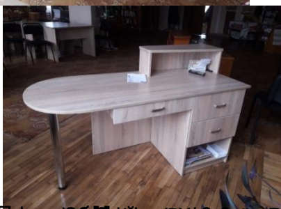
№10 Проект «Білий світ» в с.Білі Береги на підтримку діяльності бібліотеки в с.Білі Береги