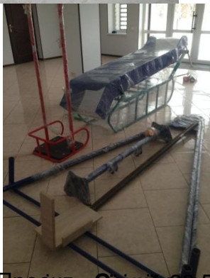
№6 Проект «Світло» в с.Білі Береги на підтримку діяльності бібліотеки в с.Білі Береги